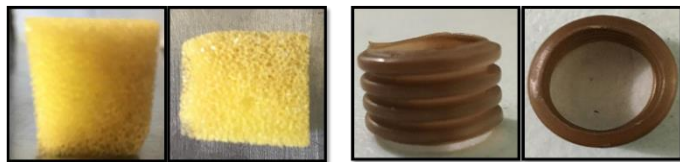
Fig. 1. Materiales de soporte empleados para la inmovilización microbiana.

Metodología. Para la realización de este trabajo se utilizó un consorcio microbiano degradador de hidrocarburos de petróleo. Se empleó medio Bushnell- Haas [5]. En matraces Erlenmeyer de 125 mL con 50 mL de volumen de operación. Se emplearon concentraciones ascendentes de melaza (2, 5, 10, 20% v/v), 1 mL del inoculo y 4 esponjas de poliuretano recicladas de 1.5 x 1.5 cm o 4 aros corrugados comerciales de polietileno de 1.5 cm de diámetro y 1.3 cm de longitud (Figura 1). Los cultivos fueron incubados a 37°C y 150 rpm durante 7 días. El consumo de melaza fue determinado cada 24 horas empleando la técnica colorimétrica de DNS [6] y realizando las lecturas de la absorbancia a 540 nm. La cantidad de biomasa inmovilizada fue determinada por el método de peso seco cada 48 horas, donde los materiales de empaque se expusieron a una temperatura de 105°C por 24 horas para conocer la diferencia entre peso inicial y final.