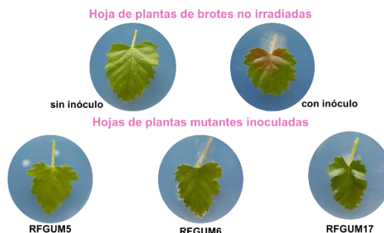
Fig. 2. Bioensayo de patogenicidad para resistencia a B. cinerea : Parte superior, hojas de planta control sin inóculo y con inóculo; Parte inferior, líneas mutantes con inóculo a los 8 días después de la inoculación.

Con los bioensayos, se confirmó la resistencia a B. cinerea de estas líneas mutantes (Figura 2), esta resistencia había sido previamente observada en ensayos con plantas cultivadas in vitro .