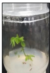
Figura 1. Planta in vitro de D. congestiflora con 3 raíces

Metodología. Se utilizaron plantas in vitro de Dalbergia congestiflora con tres raíces formadas, las que fueron colocadas en el medio de Murashige y Skoog (MS) completo, MS ¼ de sus componentes y MS con 25% (MS F-25%) de fósforo (Figura 1). En condiciones asépticas se colocó la micorriza Rhizophagus intraradices por medio de dos técnicas: fragmento de micelio con vesículas (1 cm); y por esporas (25/100 µL agua). Se tuvieron 10 réplicas por tratamiento.